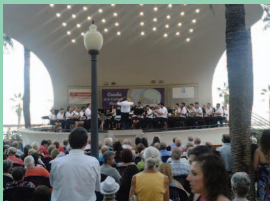
Concierto que ofreció la banda en la explanada de Alicante.