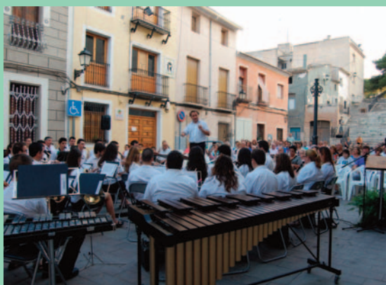
Concierto de verano celebrado en la Plaza de España.