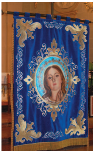
Nuevo Estandarte de La Purísima