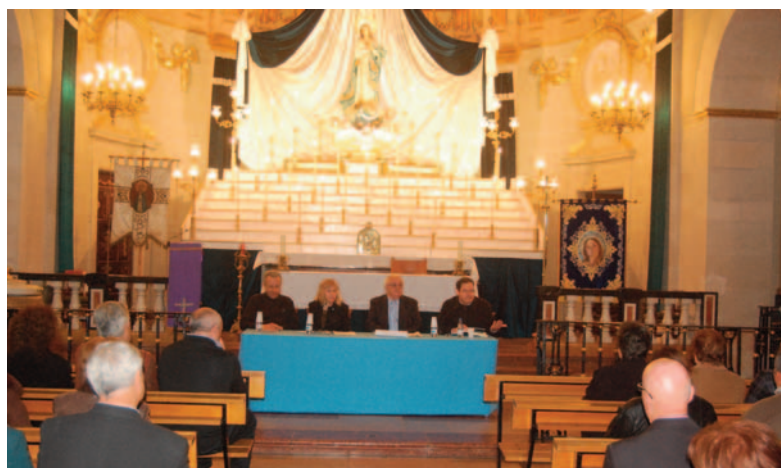
Mesa redonda sobre La Purísima