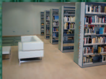
Nueva Biblioteca Municipal