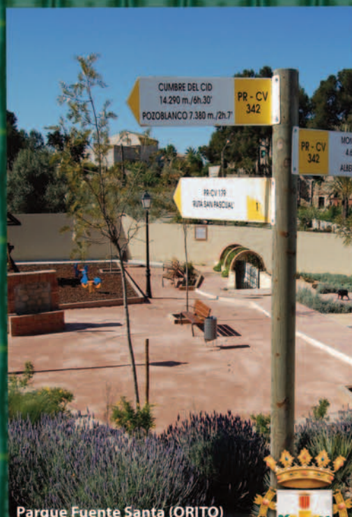
Parque Fuente Santa (ORITO)