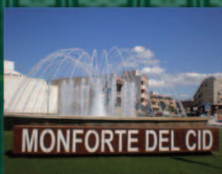
Fuente Avenida de Aspe