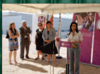
Primera Piedra Centro de Día