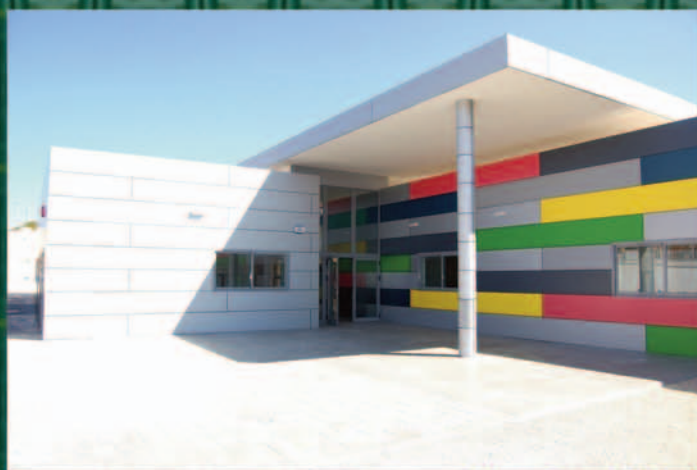
Nueva Escuela Infantil