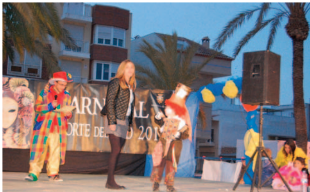
Ganador infantil individual