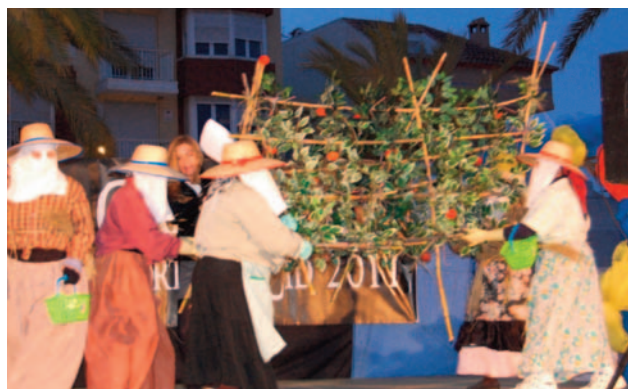
Ganador adulto grupo