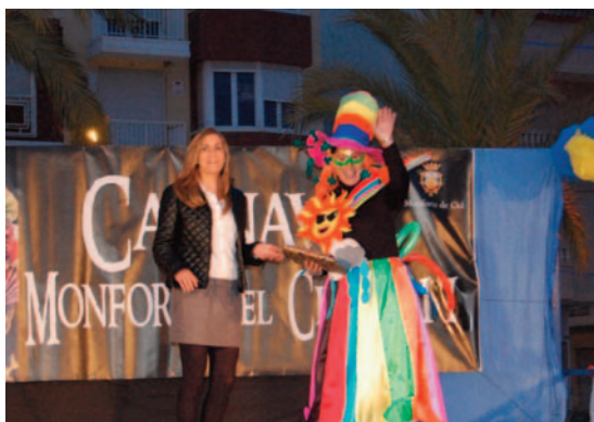
Ganador adulto individual