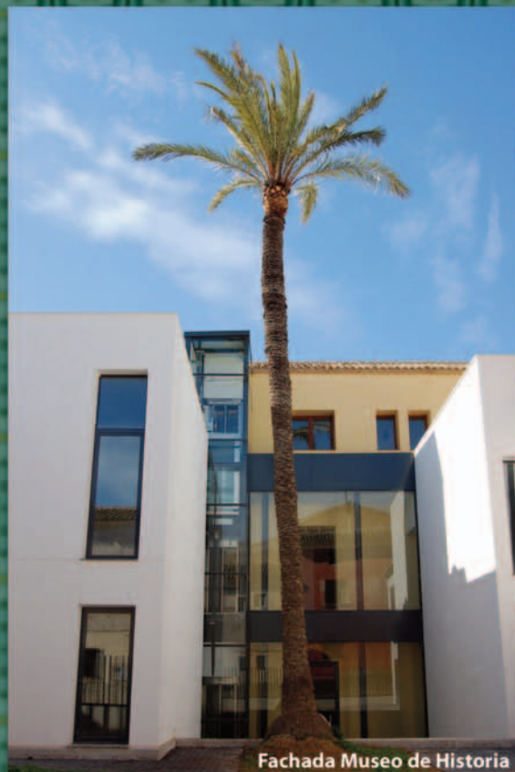
Fachada Museo de Historia