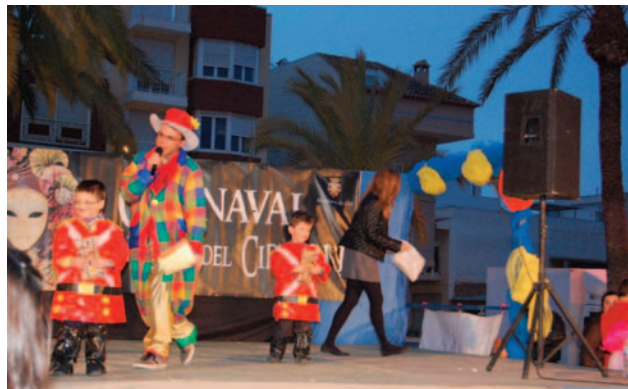
Ganador infantil grupo