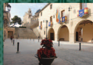
Remodelación Casco Histórico