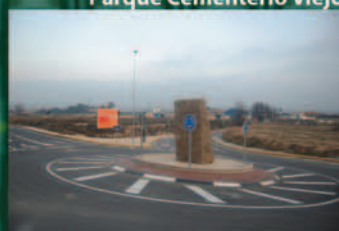
Nueva rotonda "Vuelta la Mina"