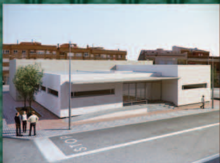
Futura Casa de la Juventud y Hotel de Asociaciones