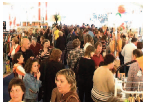
imágenes de la Feria en 2008