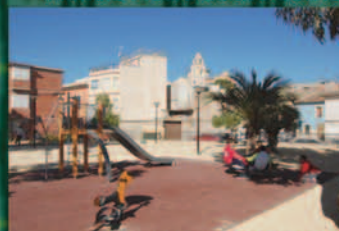
Parque Cementerio Viejo