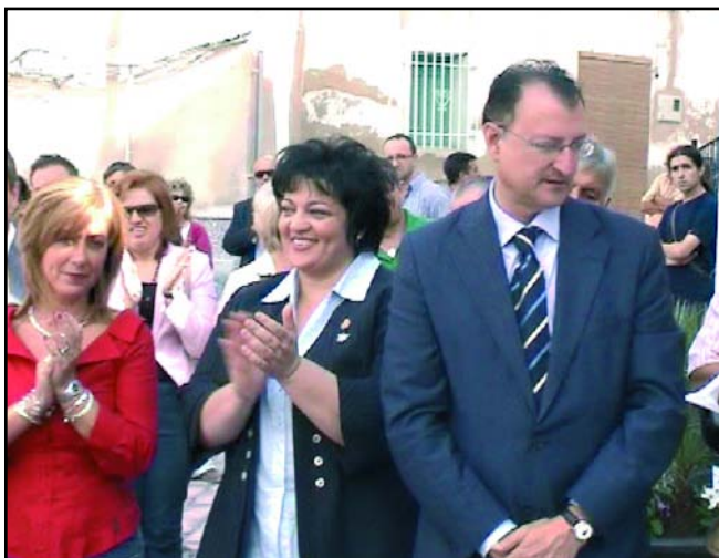
Momento del descubrimiento de la placa conmemorativa