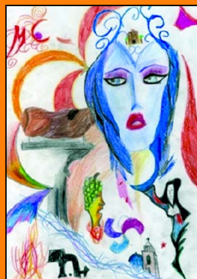
Aitor Gras Bravo, 2ªC