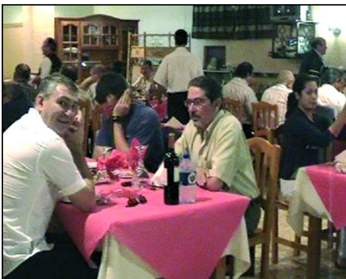
Comensales en el restaurante Los Contrabandistas

En octubre se celebraron las II Jornadas Gastronómicas que finalizaron con la asistencia del presidente de la Diputación