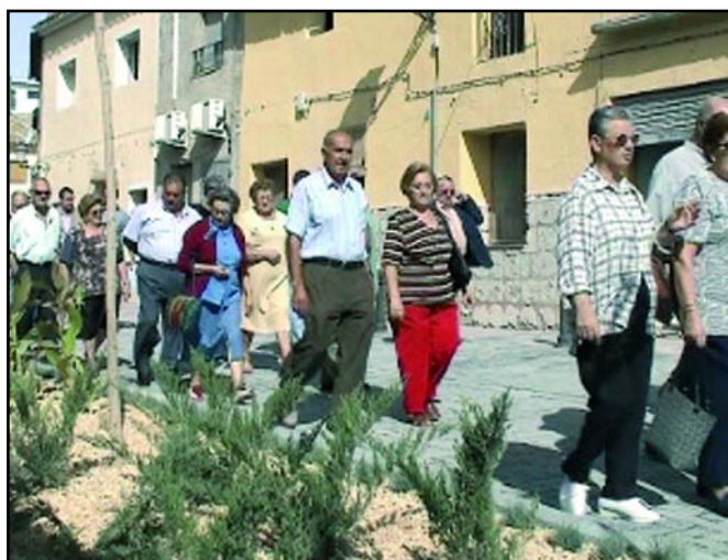
Los vecinos recorriendo las calles recién inauguradas

Se trata de una actuación que tiene la consideración de equipamiento comunitario primario en el área de rehabilitación, toda vez que se actúa sobre los viales y las infraestructuras al servicio del área. En las calles mencionadas se ha realizado una intervención de reurbanización integral de las mismas, contribuyendo así a la revitalización del centro histórico de Monforte del Cid y a su mejora y embellecimiento.