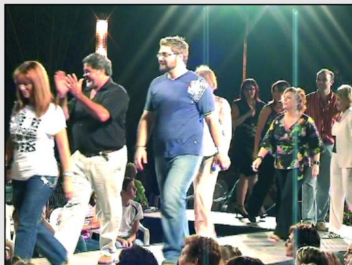
Responsables del evento saludando al público