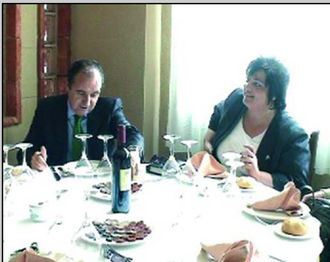
El Presidente de la Diputación y la Alcaldesa en el Restaurante Iñaki