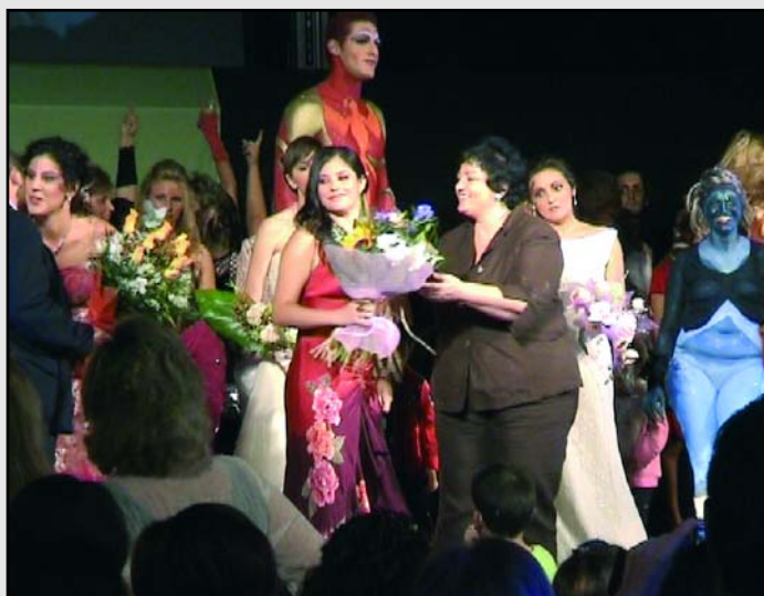
La Alcaldesa entregando ramos a las participantes