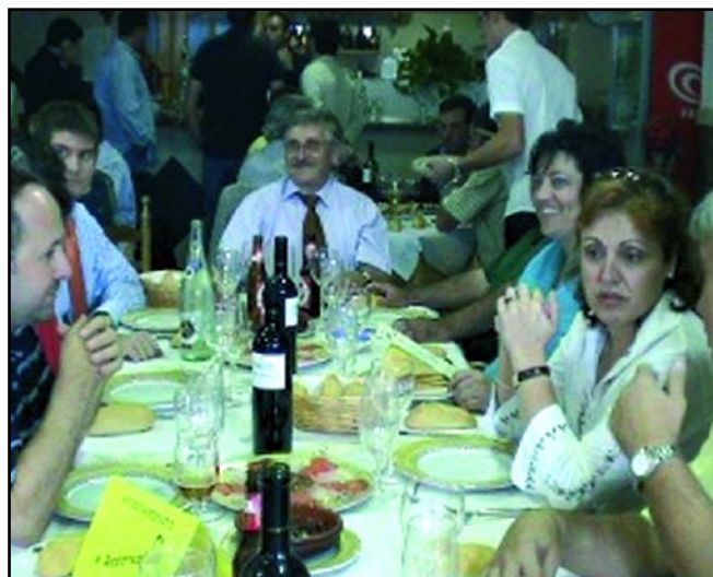
Los comensales en Casa Nemesio