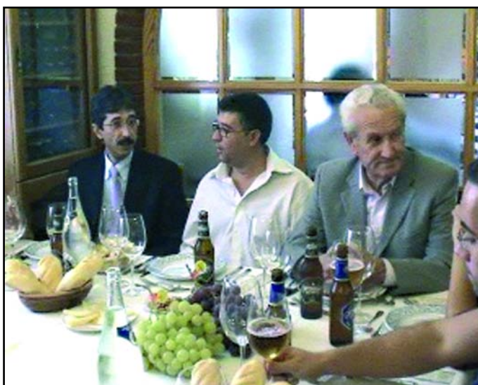
Alcaldes de la Comarca en el restaurante Ramón