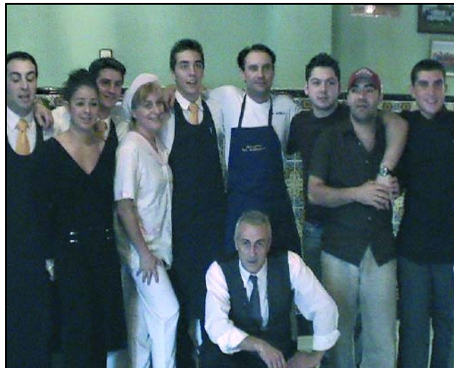
Personal de mesa y cocina de Los Moros