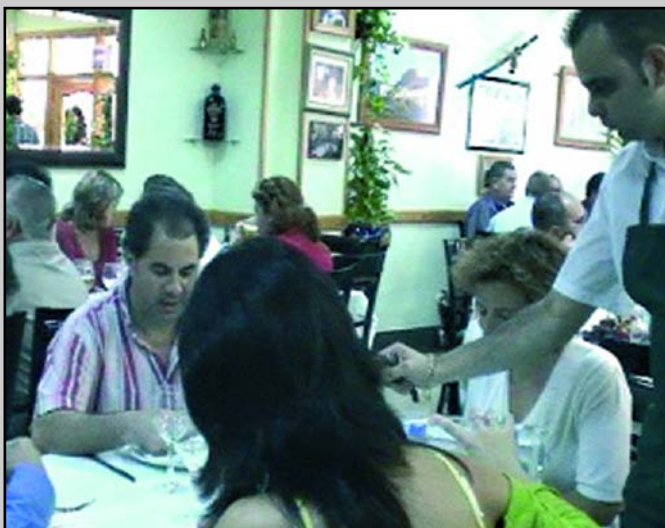
Aspecto del Comedor en Don Pepe