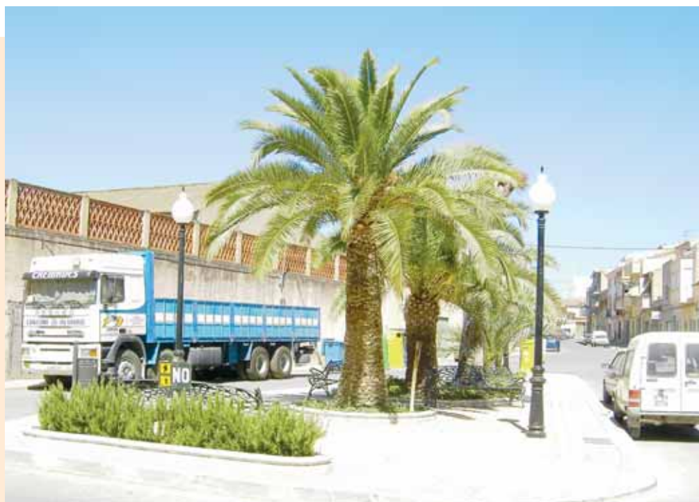
Area recreativa de San Pascual

la C/ Enrique Santos, C/ Isidro Pastor Casas, C/ Juan de la Torre, Avda de la Constitución, el antiguo cementerio o la zona de la Cruz de la Avda. Juan Carlos I que en breve estará concluida.