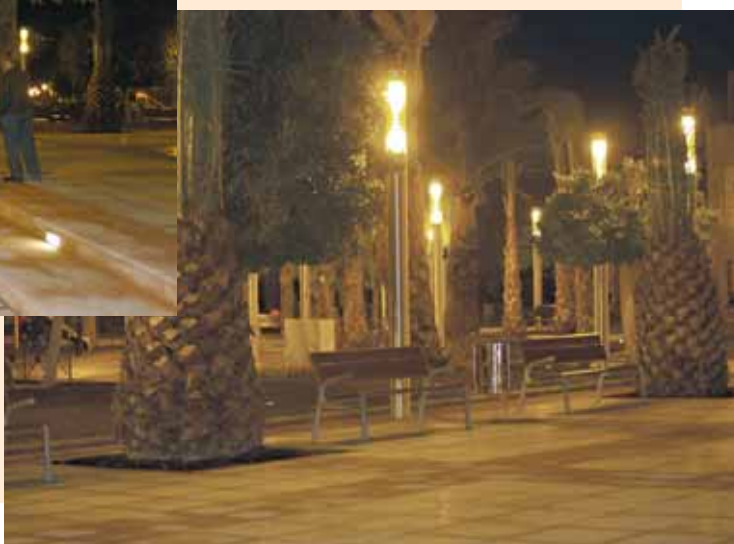
Nueva iluminación y jardines