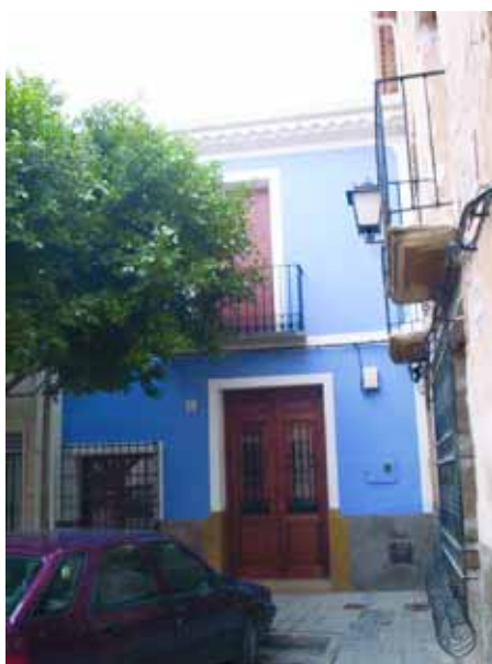
Vivienda ganadora de la primera Edición de los Premios El Cid.

de viviendas según las bases publicadas y que se encuentran a disposición de los vecinos en la Oficina Técnica Municipal. Dentro de las medidas destinadas a mejorar nuestras calles, la Corporación ha acordado suprimir los impuestos y tasas que venían gravando la rehabilitación de las fachadas en el municipio.