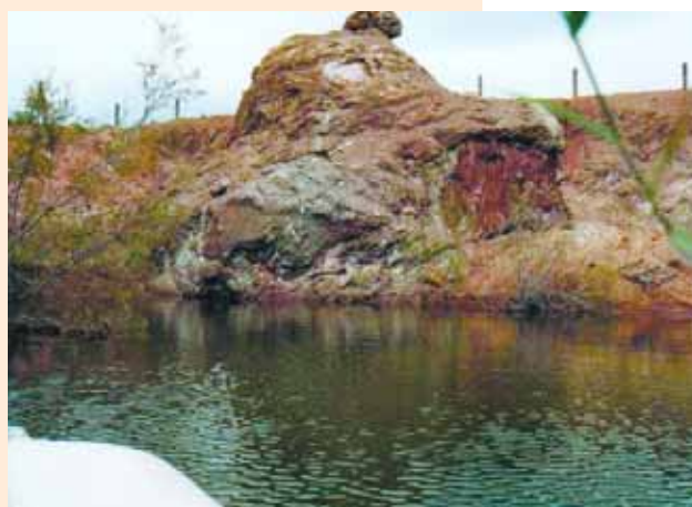
Humedal de interior, paraje de "El Gabacho" Monforte del Cid