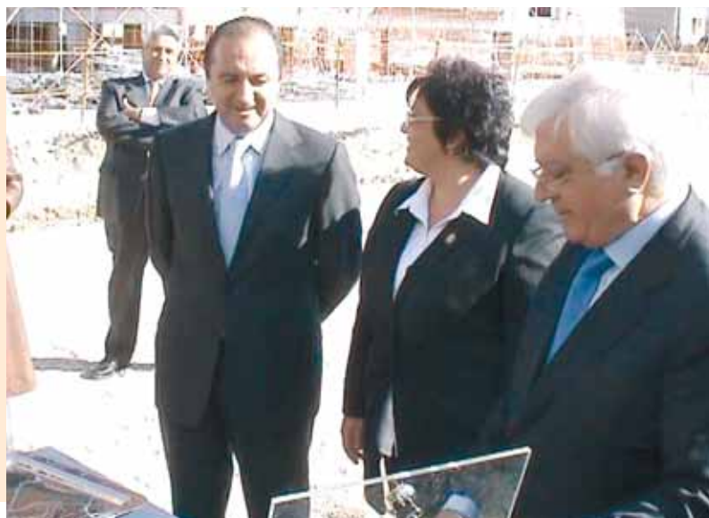
Ronda Maestro Rodrigo. Acto de puesta de la primera piedra.

- Ronda Maestro Rodrigo. Las obras de urbanización de la Ronda Maestro Rodrigo se iniciarán en breve. Estas obras cuentan con un presupuesto de adjudicación en torno a los 930.000 euros y un plazo de ejecución de seis meses. El 17 de noviembre, la Alcaldesa, junto con el Conseller de Obras Públicas y el Presidente de la Diputación procedieron a poner la primera piedra de esta importante obra.