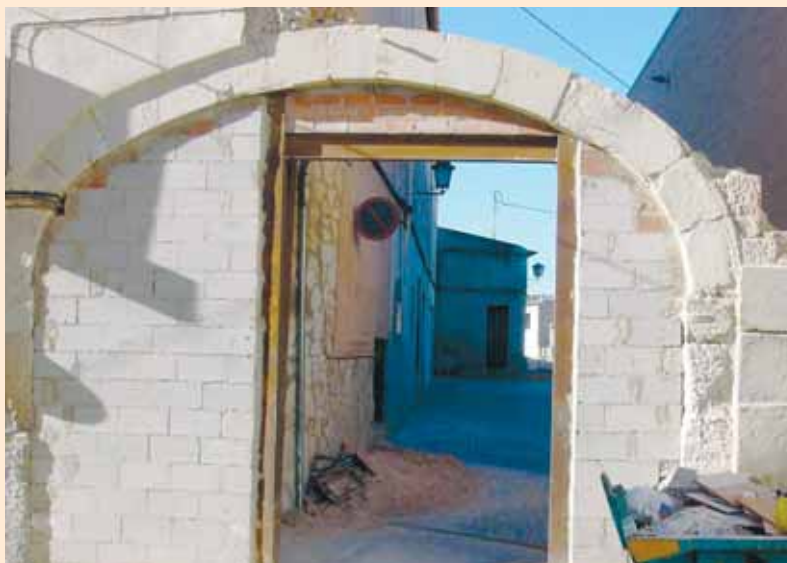
Aspecto del antiguo arco

Un viejo proyecto se ha hecho realidad en la presente legislatura: la restauración del arco de piedra de la antigua casa del cura, junto al auditorio municipal. La obra de restauración, que ha costado casi 25.000 €, ha representado cierta complejidad para lograr la mejor integración posible del arco tras su desmontaje y posterior limpieza.