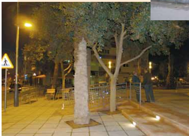
Nuevo pavimento y mejor accesibilidad