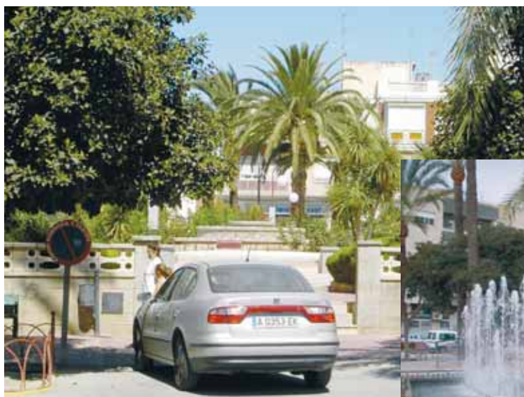
Aspecto anterior de la Glorieta